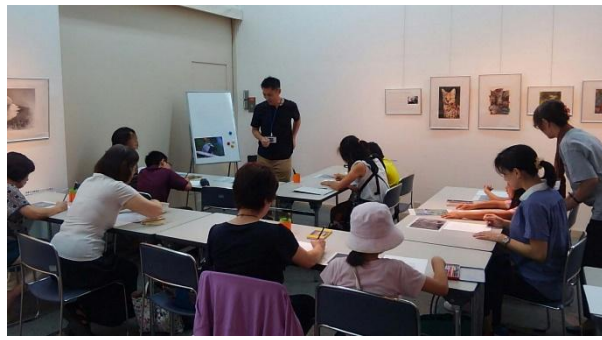
「イベント 動物画 お絵描き教室風景」