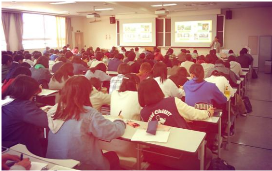
「ワイルドライフアートと野生動物保全」講演